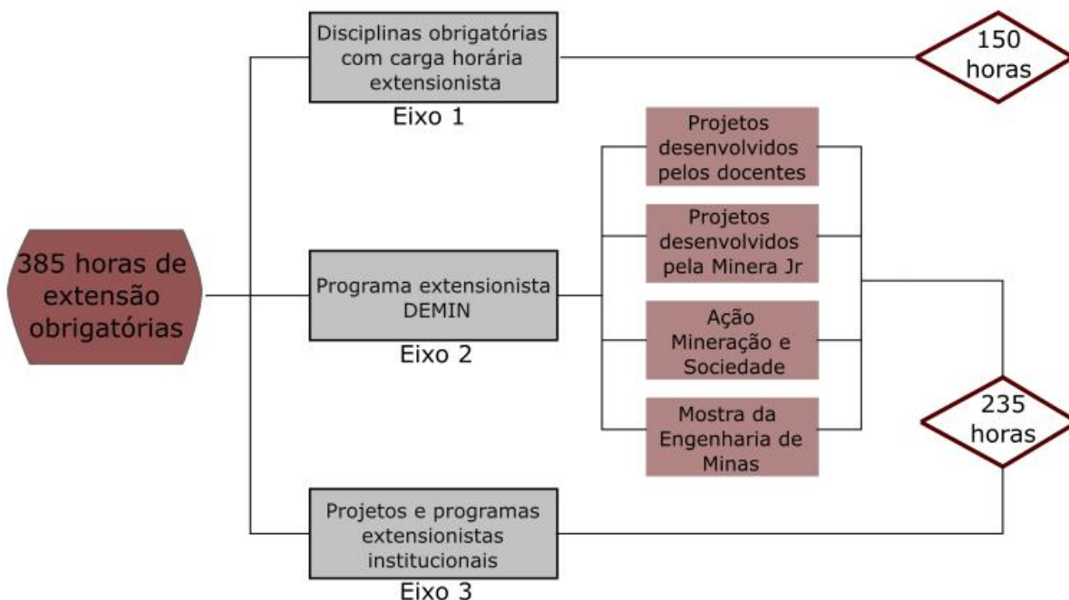
Figura 2: Estratégias para o cumprimento da carga horária extensionista exigida pelo Plano Nacional de Educação (Lei 13.005/2014).

os projetos de extensão que estão em andamento na Universidade. A Figura 2 apresenta o fluxograma de atividades extensionistas do curso de Engenharia de Minas.